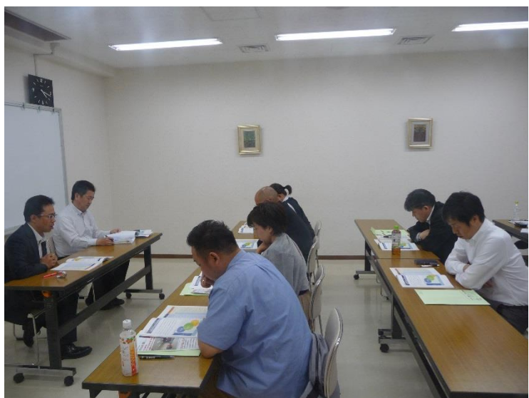
「清掃ロボット導入手引書」 説明 (株)アクティオ