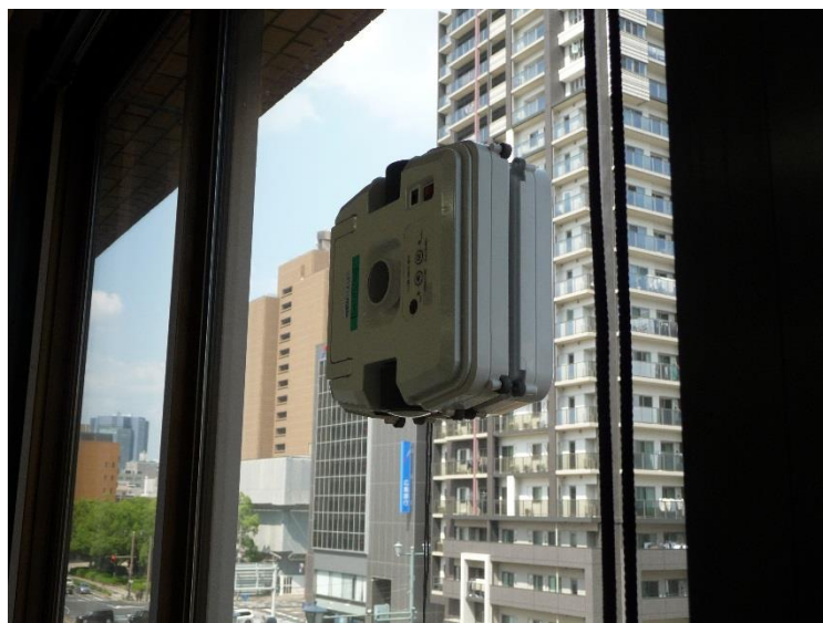
窓清掃ロボット ウインドウメイト ② セールス・オンデマンド(株)