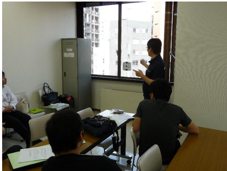
窓清掃ロボット ウインドウメイト ① セールス・オンデマンド(株)