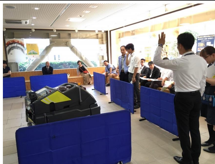
床洗浄ロボット SE-500 i X II ① アマノ(株)