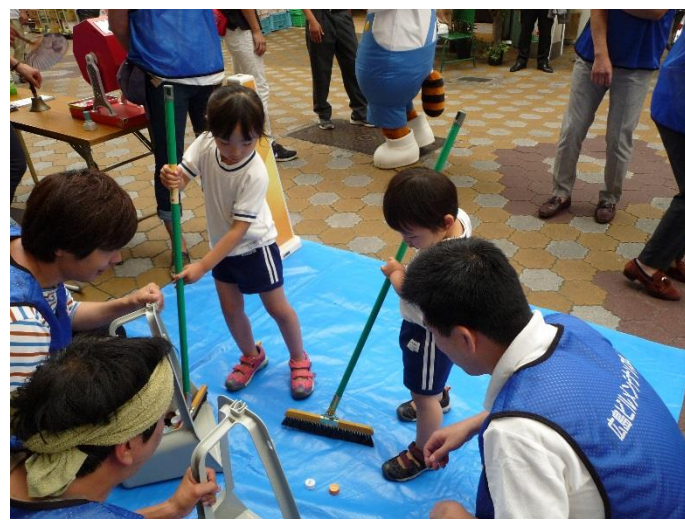
兄弟で一緒におそうじ