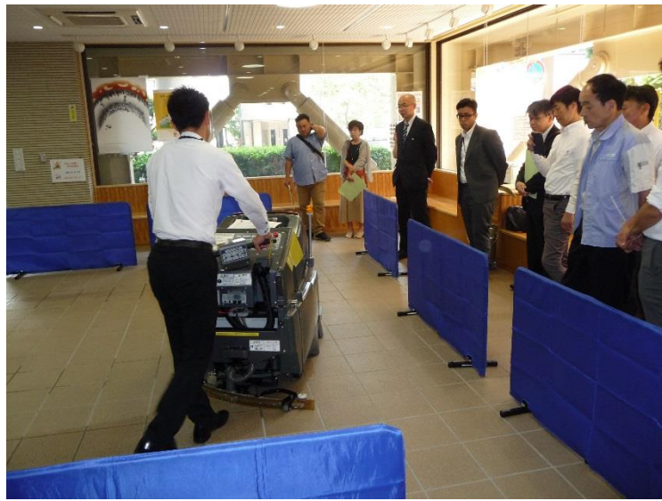
床洗浄ロボット SE-500iXII ② アマノ(株)