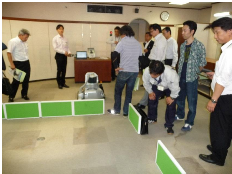
清掃用ロボット エフロボ・クリーン ① フィグラ(株)