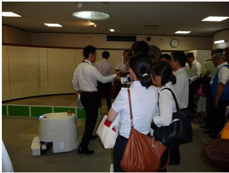
清掃用ロボット RcDC ② アマノ(株)