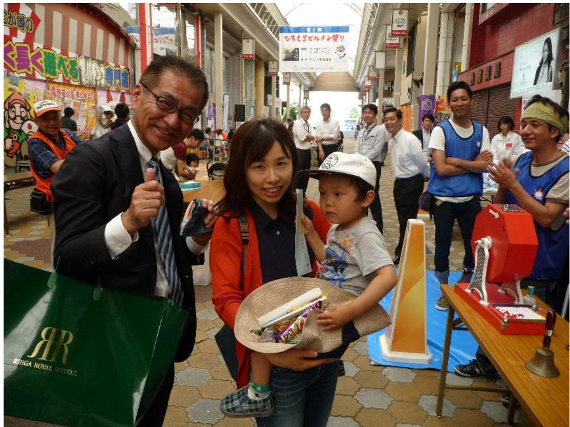
特賞、当たりました。 おめでとうございます。 (杉川会長と記念撮影)